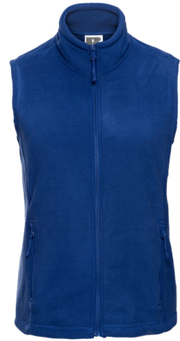
872F Ladies' Outdoor Fleece Gilet SIZE XS-2XL