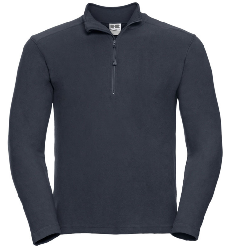
881M Men's Quarter Zip Microfleece SIZE S-2XL