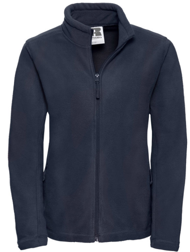
870F Ladies' Full Zip Outdoor Fleece SIZE XS-2XL